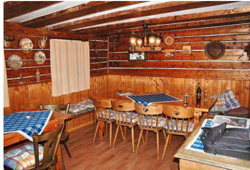
... in die Stube