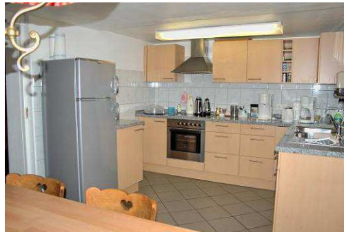
... in die Küche