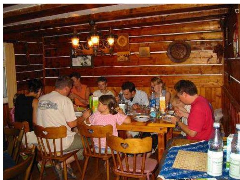
... mit einem gemütlichen „Innenleben“