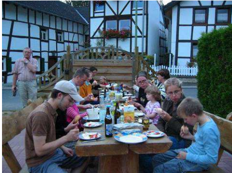
... ein uriges, altes Gemäuer