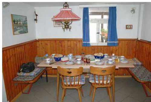
... ins „Eck“